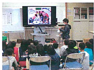
4年生 プレゼン発表