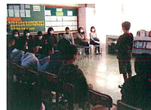
6年生 6年間の思い出発表

次年度(29年度)の1回目の参観日(PTA総会)は4月22日(土)です。町議会選挙のため例年の日曜日から土曜日に変更です。