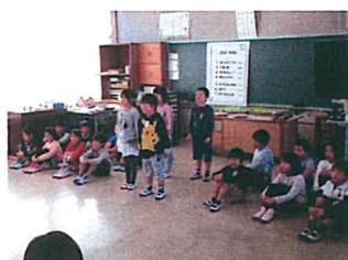
2年生 班別九九の発表