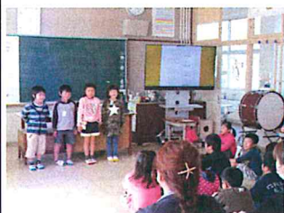
1年生 班別音楽発表

親の顔が見えると子どもは張り切る。その姿を見て親が微笑む。そんな瞬間がすばらしいと思う。懇談で、保護者が一人ずつ我が子の成長を話してくださり、とても温かい会になってありがたかった。