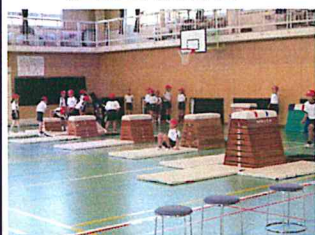
3年生 跳び箱(台上前転)