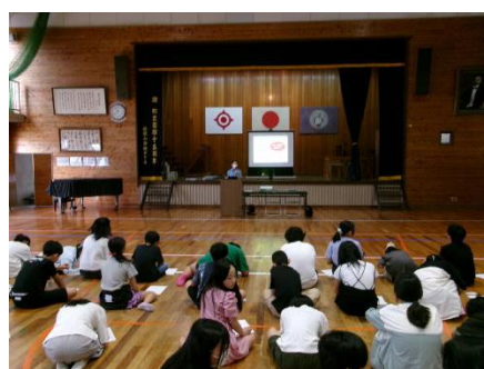
非行防止教室 上学年

宮崎県教育庁より「インターネット上のトラブル未然防止のための啓発リーフレット」では、「みんなでスマホ使用のルールを決めよう」に、次のようなものがありました。SNSに個人情報を書けない、スマホを使用する時間を決める、安易に知らない人とつながらない(会わない・話さない)、困ったときは大人(保護者・先生)に相談するです。気をつけていきましょう。