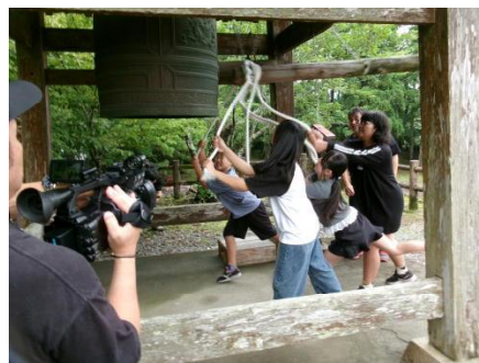
時の記念日行事 6年

飫肥ならではの伝統ある行事に参加し、6年生は気持ちを新たに自信をもって今を、未来を生きていくことでしょう。貴重な経験になりました。