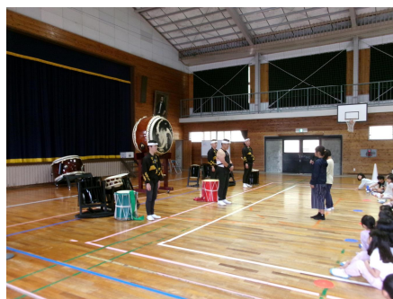
鑑賞教室・橘太鼓響座