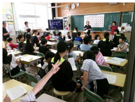
手話・点字福祉体験 3年