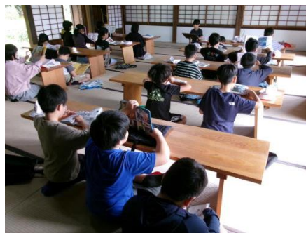
振徳堂での読書活動 4年