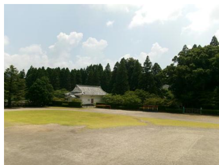
飢肥城の向こうに入道雲