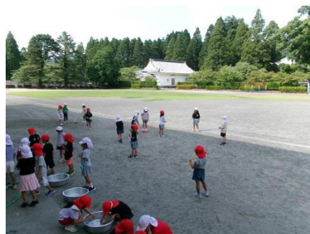
なつとなかよし 1年