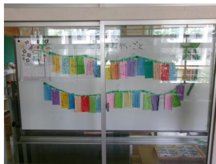
セタのねがいごと

小・中学生が日南市の今や将来のことを真剣に考えてくれます。心から頼もしく思いました。