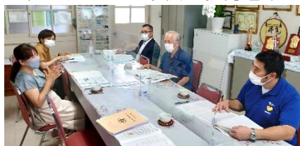
【学校運営協議会の様子】

6月20日から22日にかけて、学年部ごとに分散して行いました。今年度最初の参観日になり、平日にもかかわらず、多数来校いただき本当にありがとうございました。また、その期間にあわせて、第1回学校運営協議会も開催することができました。学校と保護者の皆さん、地域の方々とは、ようやく繋がり、子ども達の成長のために一緒にがんばっていける令和4年度が本格的にスタートできた気がします。PTA 活動も少しずつですが活動が始まり、19日(火)には、第1回実行委員会も計画されています。またまたコロナ感染者が増加してきていますが、ウィズ・コロナで『出来ることを最大限に』を合い言葉に、これからも本校の教育活動に対するご理解とご協力をよろしくお願いします。