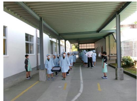
整然とした給食当番の移動