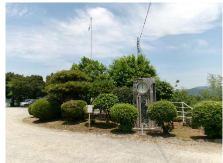
伝統ある時計塔と掲揚柱