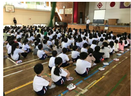
5月全校朝会の様子

そこで、子どもたちに「皆さんも、思い悩んだり、困ったりしたときには、吾田小学校の先生に相談してください。先生方は、真剣に対応してくれます。」という話をしました。相談すると、解決がより早まります。