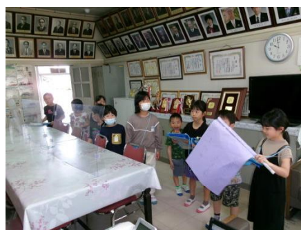
1・2年生の学校探検

とても爽やかで、ほっとする歌声に、毎回心を和ませています。日曜日の朝には心も弾みますので、ぜひご視聴ください。