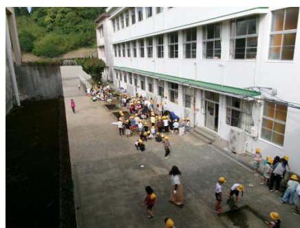
朝の活動「みどりタイム」

5月12日(金)には、朝の活動「みどりタイム」を行いました。そのときには、6年生が重い堆肥袋を運んだり、下級生の仕事のサポートをしたりしてくれていました。自分たちから進んで行動に移す姿に、最上級生としての前向きな自覚が感じられていました。頼れるお兄さん・お姉さんたちがいっぱいいてくれるので、吾田小学校はどんどんよくなります。