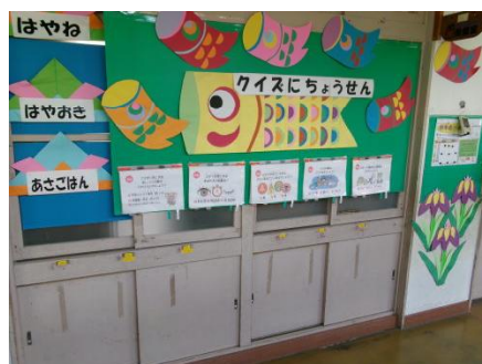
保健室の5月の掲示