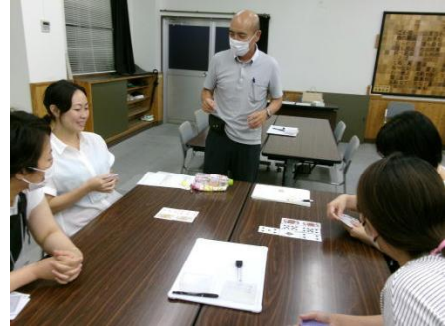
あしたば学級の様子

最後に、「おこだでませんように」の読み聞かせがありました。我が子の短所よりも長所に目を向け、個性を伸ばしていきましょうという内容でした。