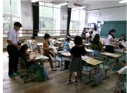
中学生の職場体験学習