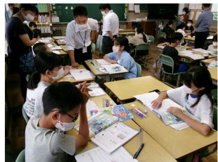
5年算数 初期研修授業