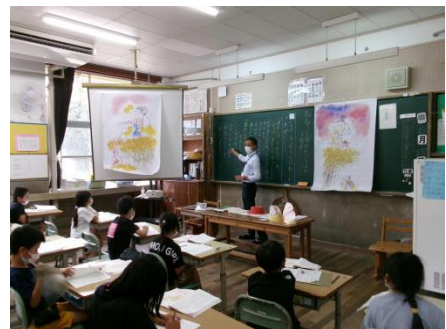
2年国語 初期研修授業