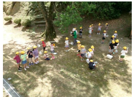
1年 シャボン玉遊び

実は、この3つの力は、「生徒指導の3つの機能」と呼ばれているものです。友達の気持ちに寄り添ったり、自分は自分でよいと実感したりすることが大切です。また、自分のことは自分で決める体験も必要なのです。子どもの人権を何よりも大切にしていこうことが子育ての基盤であるように思います。