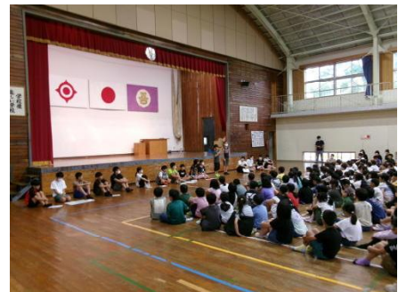
吾田っ子集会・委員会紹介

健康であることのありがたさを伝え、お体をくれぐれも大切にしてくださいと話しました。