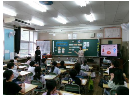
栄養教諭 食育の授業

また、先生方が丁寧に指導してくれた水泳が上達するコツを忘れないようにしておきましょう。