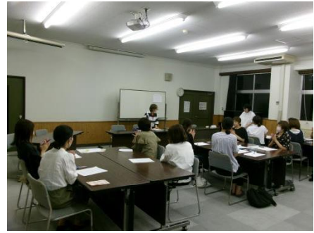
あしたば学級の様子

最終的には、「しかるよりほめる」を大切にしていきたいと思いますという結論にたどり着きました。子どもをほめるという自信がついて、自己肯定感が高まります。