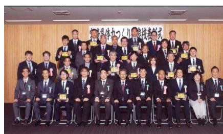
令和6年度 宮崎県体力づくり優良校表彰式 令和7年2月17日 於:鹿児島庁舎

何事も前向きにチャレンジし、数少ないチャンスを生かして、チャンピオンを目指してきたことの成果です。今後につながる表彰に心より感謝しています。