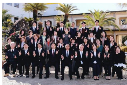
日南市立吾田小学校 令和6年度職員一同