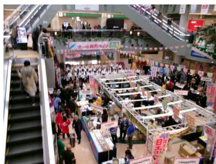
オール日南フェア