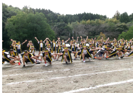
運動会 吾田っ子ソーラン

193号では、「交差点[全国からのお便り]」にて、「交差点に立つ」という投稿が載りました。2年間、さくら坂下の交差点に立つことを習慣化してきました。高学年の子どもから「大変ですが、頑張ってください」と励まされ、背中を押してもらえことのありがたさを実感したという出来事です。挨拶や会釈をしてくださる方も増え、やさしさや思いやりの温かさに包まれて、冬でもぽかぽかとした気分になれましたという内容です。