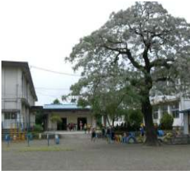
[登校を見守る花満開のセンダン]