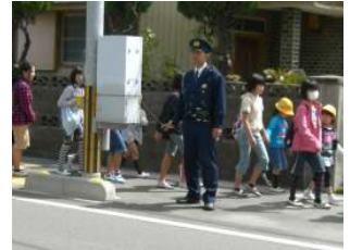
[駐在所員さんも協力]