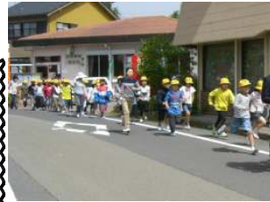
[あわてず、いそげ!][130段がんばろう!]