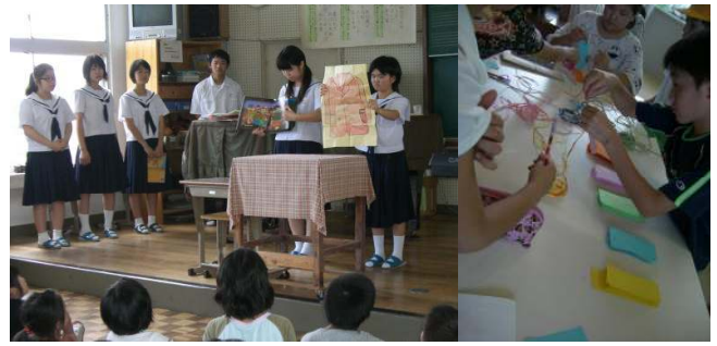
〔心を込めた中学生の読み聞かせ〕〔オリジナルの葉〕

小中学校では、読書活動推進の取組として、「くすのきブックフェア」を実施しています。初日の6/22昼休み時間に、中学校の読書委員会の生徒が小学生に読み聞かせをしてくれました。聞き手も参加できる形の読み聞かせなので、小学生たちは大喜びで聴いていました。並行して図書室では葉作りもあり、多くの小学生が参加していました。