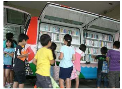
〔「たいよう号」大盛況！〕

毎週水曜日の朝には、学級PTAの皆様方が中心となり、PTA読み聞かせ活動をしていただいています。お忙しい中、ありがとうございます。子どもたちは、毎週楽しみにしています。