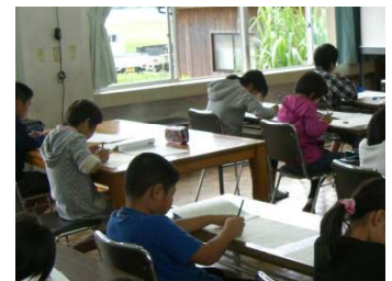
[よし！これならできる!]

毎年、小中PTA学力向上委員会が実施している漢字検定試験に、今年は20人の子どもたちが挑戦しました。「漢字」は、普段から国語学習でも練習してテストしていますが、このように全国的な検定試験を受けて、自分の力を試そうとする子どもたちの心意気が素晴らしいと思います。頭脳のチャレンジャー、もっと増えてほしいです。