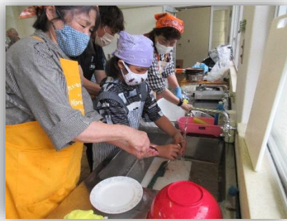
【内臓等を洗い出す】