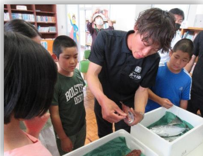
【新鮮さを保つ工夫の説明】