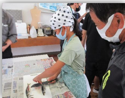
【うろこ&せびれ&頭を取る】