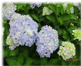
体育館横のあじさい

梅雨の花と言えば、あじさいを思い浮かべる人も多いと思います。あじさいは英語で「Hydrangea」、「水の器」という意味です。小さな花が集まり、雨のしずくを受けて輝いています。本校体育館横に咲いているあじさいもこの雨を受けキラキラ輝いています。