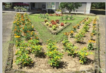
【現在の花壇】の様子