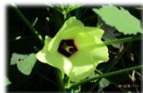
学級花壇オクラの花