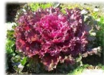
学校花壇の葉ボタン