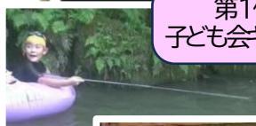
第1位 子ども会キャンプ