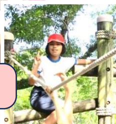
第3位 大窪神社大祭