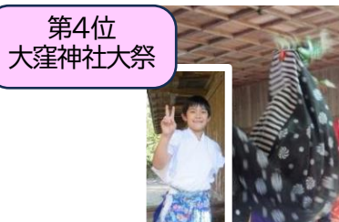
第4位 大窪神社大祭