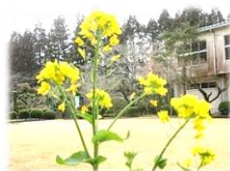
中庭花壇の菜の花