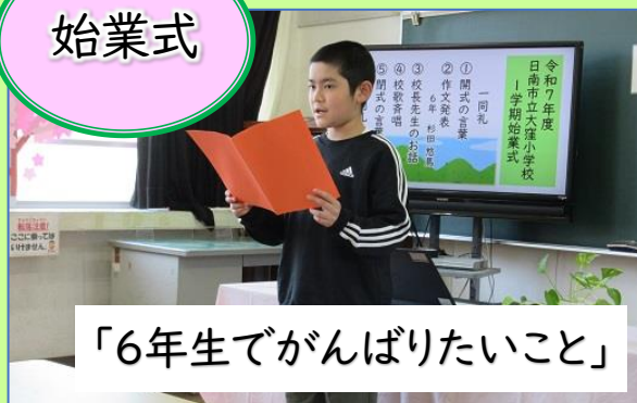
「6年生でがんばりたいこと」

今日から6年生がスタートします。2人での学校生活なので、正直なところ、不安な気持ちも多々あります。しかし、大窪ならではの行事もあるので、楽しい気持ちもあります。 6年生でがんばりたいことを2つ考えました。 1つ目は、国語のテストの点数が上がるように勉強することです。そのため、