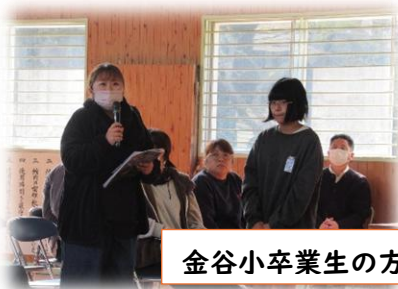
金谷小卒業生の方々にインタビュー