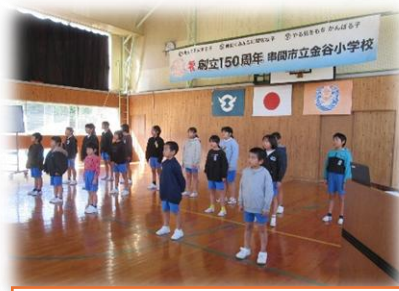
心をこめて合唱「ふるさと」