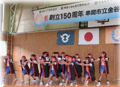
オープニングのソーラン節！