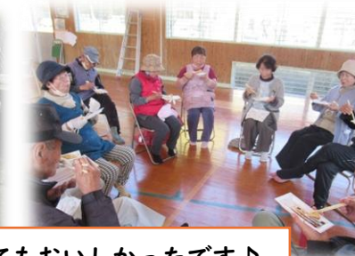
もちつき大会は地域の方々も一緒に！もちがとってもおいしかったです♪