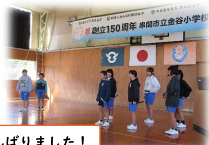
5・6年生「金谷の歴史」 全員で力を合わせがんばりました！

150周年記念発表会では、全校のみんなでソーラン節を踊り、合唱「ふるさと」や「校歌」を歌いました。また、5・6年生が総合的な学習の時間に金谷の歴史について、調べたことを劇やプレゼンにまとめ、発表しました。他にも、金谷小の卒業生のインタビューの動画や、金谷小のこれまでの姿を画像で振り返るコーナーもありました。約1時間の記念発表会を終えて、保護者や地域の方から「とってもよかった」「子どもたちに元気をもたらえた」「観に来てよかった」と感想をいただきました。