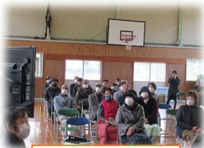
金谷・下弓田の皆様