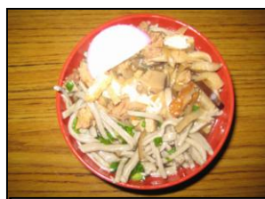
できあがったそば

今年も19日（月）にそばうちを体験させていただきました。そばをうった後は、試食です。とてもおいしくて、たくさんごちそうになりました。