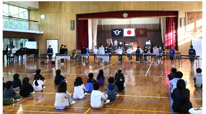
11月7日児童集会での演奏の様子

11月14日(金)に串間市音楽会が実施されました。当日の写真は著作権の関係で掲載できませんが、大束小は「ケセラセラ」を3~5年が演奏しました。1週間前の児童集会で披露した時よりも素晴らしい演奏で、演奏を終えた後に大きな拍手をいただきました。この経験に自信を持ち、これからの学校生活に生かしてください。