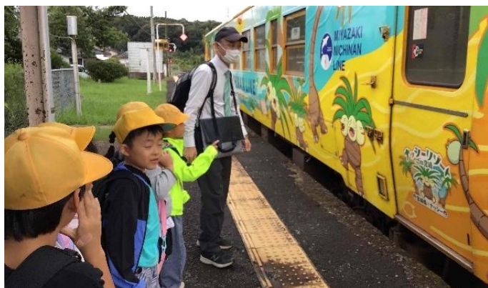
ナッシーの電車に乗りました