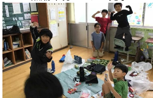
みんなで学校でお弁当