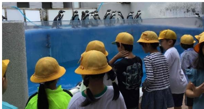
ペンギンも見ました