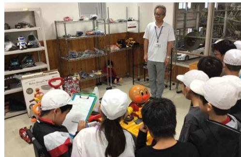
黒潮環境センター見学

1, 2年生は朝、大東駅に集合して電車を待ちました。朝の電車はナッシーでみんな大喜びでした。その電車に乗って、高松駅まで移動して、そこからは徒歩でイルカランドまで行きました。途中で高松海水浴場によって遊具で遊んだり、イルカランドで動物を見たりして、みんな楽しく過ごしました。