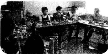
みんなで会食!!「美味しいー♪」

8月23日(水)夏休みの一日を利用し、本城小学校児童と本城地区在住の高齢者の方たちとのふれあい給食会(世代間交流)を行いました。当日の参加者18名。(小学生6名。保護者2名。高齢者10名。)また、ボランティアとして串間市食生活改善推進協議会から4名の協力を頂き、食事作りにも参加。おいしい昼食の出来上がり!!