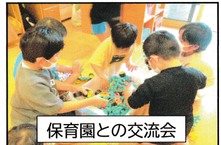
保育園との交流会