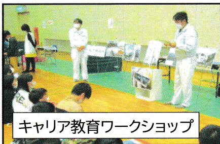
キャリア教育ワークショップ