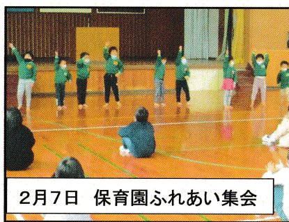
2月7日 保育園ふれあい集会

SDGsに関する学習をリモートで行いました。謎解きで問題を解き、説明を聞く形式で進められました。自分たちの今後の行動について学ぶことができました。