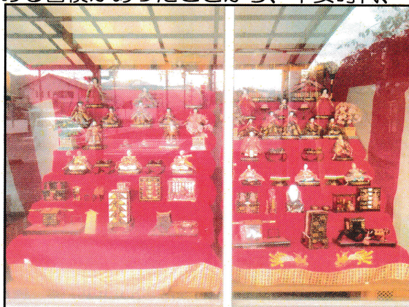
本城交差点に飾られているひな人形

3月と言えば「ひな祭り」です。ひな祭りの由来には諸説がありますが、中国の五節句のうちの一つ、「上巳の節句」（桃の節句とも言います）が日本に伝わったとされています。季節の節目となる節句の頃は邪気が入り込みやすいと言われていたため、この頃に邪気を払うための行事が行われていたようです。中国では川で身を清める習慣があったことから、平安時代、それにならって紙の人形に自身のよごれをうつして川に流す「流し雛」が行われていたと言われています。そして、人形がだんだん立派になり、貴族の子どものあいだで流行っていた「ひいな遊び」と呼ばれる人形を使ったおままごとと結びついていったようです。このひいな遊びが江戸時代にひな祭りへと変化し、女の子のための行事として家に人形を飾る風習が定着したと言われています。