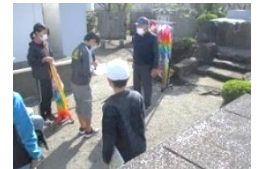
宮崎特攻基地慰霊碑

11月9日と10日に、6年生が都井小、金谷小と合同で宮崎市と西都市へ修学旅行に行ってきました。宮崎特攻基地慰霊碑などでは特攻隊員の話や戦争中の話を聞き平和のありがたさなどを学びました。西都原考古博物館や宮崎総合博物館、宮崎科学技術館では歴史、自然や科学について見学、体験しました。宮崎航空大学校では、飛行機を着陸させる操縦シミュレーター体験や管制塔見学、訓練用飛行機の説明など、修学旅行ならではの学習ができました。修学旅行を通して、他校の友達とのふれあいなど、良い思い出ができました。