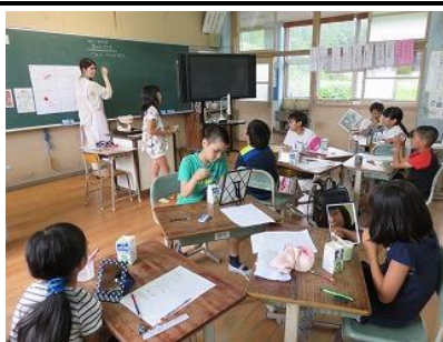
<6.1 ナイトレンジャー>

丈夫な歯を作る授業を4年生で行いました。 養護教諭の先生が、丈夫な歯を作るための大事なことや、歯の正しい磨き方について授業を行いました。児童は、真剣に自分の歯を観察していました。