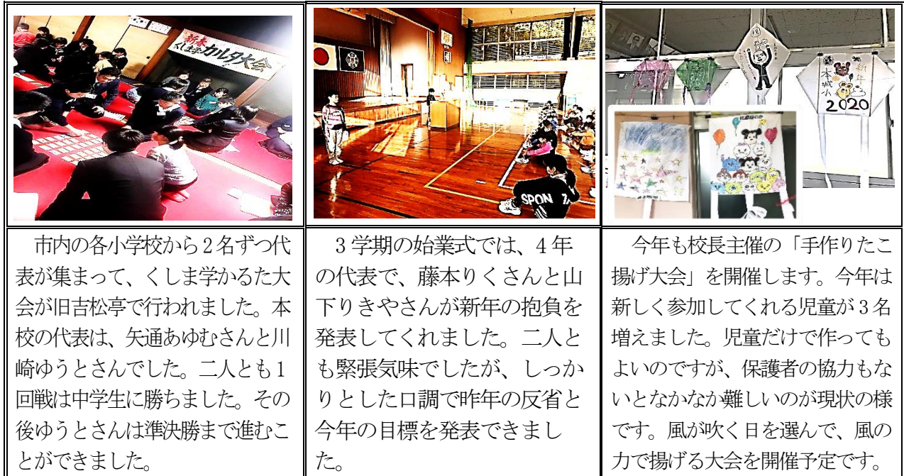
<1, 7 くしま学かるた大会 >

小学校では、今年もエコエネルギーとしての風に焦点をあて、風の力で揚げる「手作り凧揚げ大会」を計画しています。子どもたちも凧のように大空に大きく飛ばたいてくれることを祈っています。