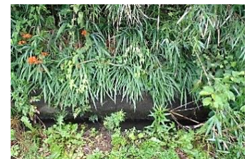
草におおわれ見えにくい ふたのない側溝