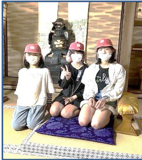
【5 / 2 遠足 : 6年生】