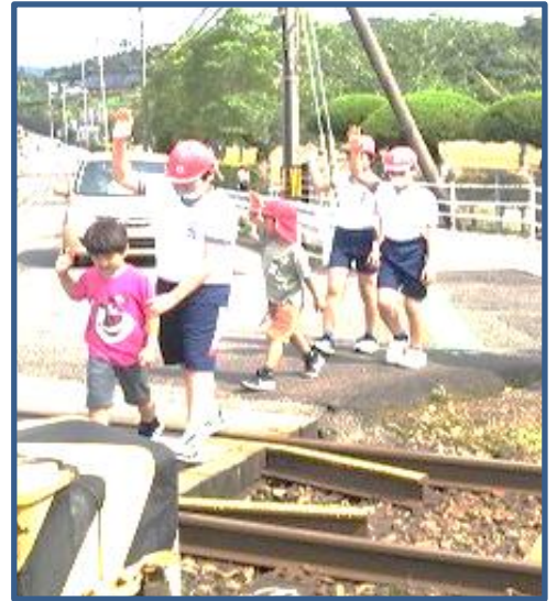
【5 / 7 交通教室】