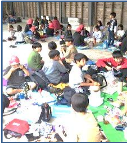
【5 / 2 遠足 : 4年生】