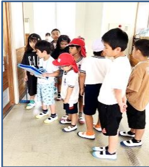
【5 / 15 学校紹介 1・2年生】