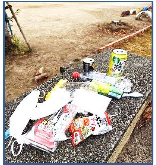
【子どもたちが朝拾って来たごみ】

もちろん、良い行いの情報も大歓迎です。登校中にごみを拾っている子たちがいます。地域美化に貢献しています。