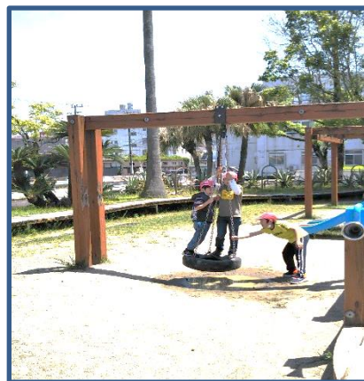
3年生：警察署と公園