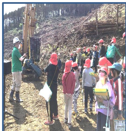
4年生：餌肥杉伐採現場