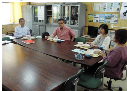
【給食試食後の意見交換】