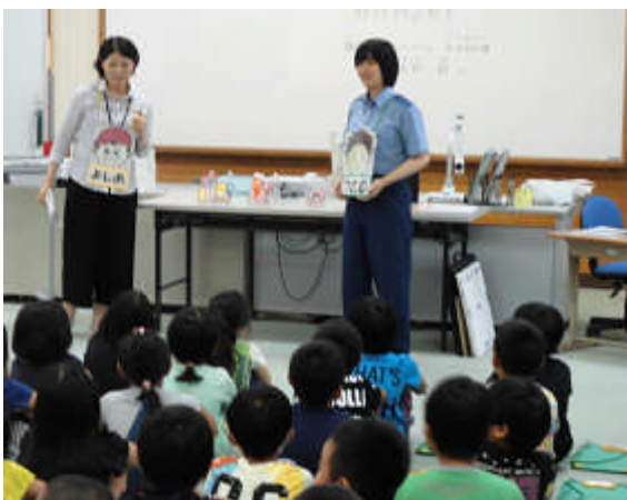
[3年生が参加した「非行防止教室」]