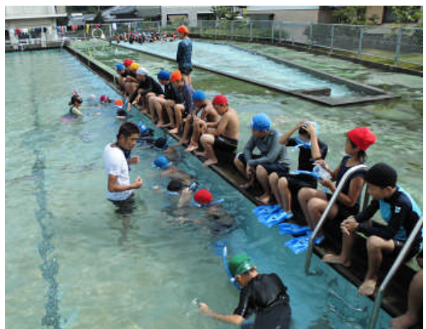
[5年生の「海洋科」シュノーケリング体験(11月には「弧島」(栄松)で実体験します。)]