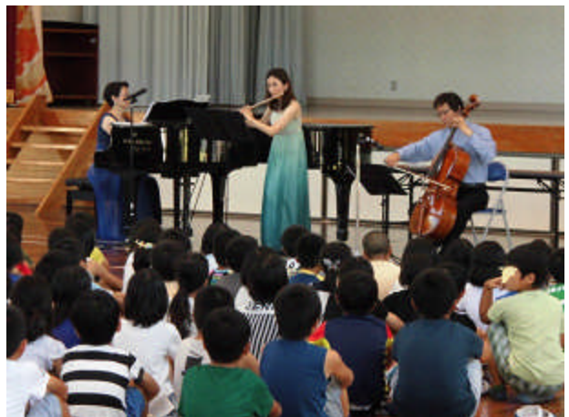
[全校児童が参加した「スクールコンサート」]