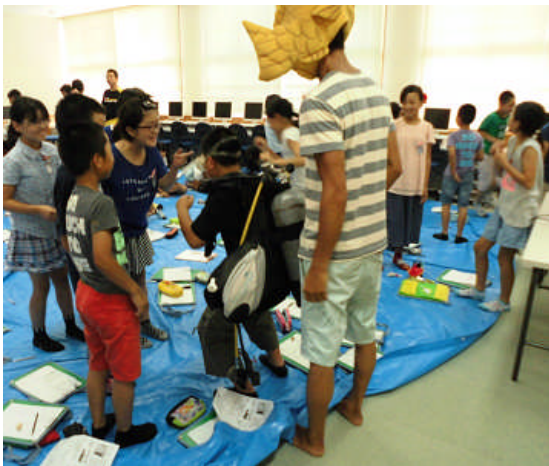
[5年生海洋科「南郷の海」に関する学習]