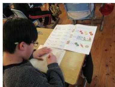
リーディングのテスト