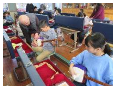
三味線の演奏は楽しいです

6年生は音楽科の学習で三味線の演奏に挑戦しました。講師は、本校の運動会で毎年披露している俵踊(たわらおどり)の伴奏をしてくださっている三味線教室の先生です。初回は三味線の仕組みの説明を聞き、バチの持ち方、三味線の持ち方・構え、バチを糸(弦)に当てる練習をしました。6年生は、講師の説明を聞き、慣れない手つきで三味線を弾き、音が出るとうれしそうに何度も弾いていました。2回目以降は、簡単な曲の節や伴奏の練習をしました。短時間でも上手にできる児童がたくさんいました。