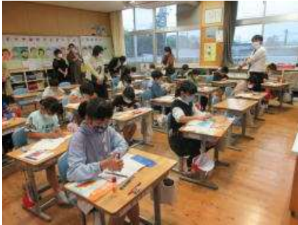
4年：算数「角の大きさ」

4月24日(日)に、本年度最初の参観日を行いました。授業参観では、新学年で新しい学級担任による授業を行いました。お子様が新学年で頑張っている様子を見ることができたことと思います。学級懇談では学級役員などの選出をしていただきました。保護者の皆様、朝早くからの授業参観・懇談会出席、ありがとうございました。PTA総会は、コロナウイルス感染対策のため、書面決議で昨年度のPTA活動・決算の報告、役員改選、本年度の活動計画・予算案の承認となりました。ご協力、ありがとうございました。