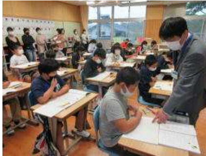
6年：算数「文字を使った式」