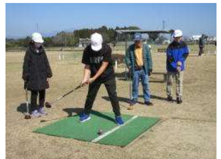
難しいけど楽しい！

3月1日のお別れ遠足は、前日の雨のため校内遠足に変更しました。そこで、遠足の時に予定していた6年のパークゴルフを延期して、後日行いました。6年生は初めての児童が多いので、グループに地域の方々に入っていただき、打ち方やルールなどを教わりながら一緒にプレーを楽しみました。ボールが思ったように打てず苦戦する児童もいましたが、時々好プレーも見られ、地域の方と楽しく会話をしながらパークゴルフを楽しんでいました。地域の皆様、ご協力ありがとうございました。