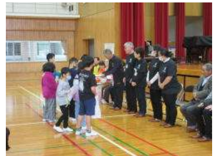
感謝状を渡す様子

本年度児童のために支援をしていただいたボランティアの方々を招き、児童が感謝の気持ちを伝える「ボランティア感謝集会」を行いました。本年度の支援ボランティアは、登下校見まもり隊、読み聞かせ・紙芝居、八反俵踊保存会、三味線教室、家庭科学習支援の方々です。集会では、児童がボランティアの方々に感謝状を手渡し、感謝の気持ちを伝えました。ボランティアの皆様には、児童の安全、学習支援、情操教育、伝統芸能継承などで大変お世話になりました。ありがとうございました。