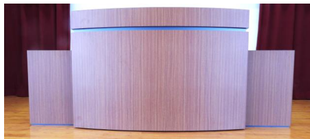
②体育館行事用演台