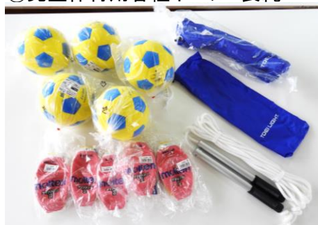
⑧児童体育用各種ボール・長縄