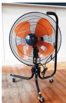
⑥体育館用キャスター付扇風機