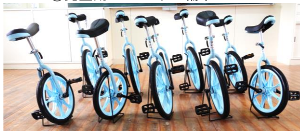
⑦児童用ノーパンク輪車