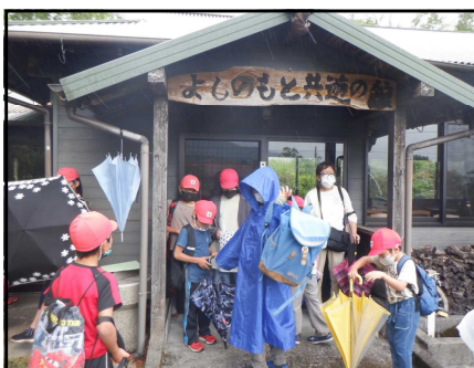
吉之元よかところ発見塾