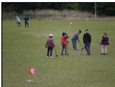
グランドゴルフ場

5/10(火) 全校13名全員揃って吉之元の「よかところ見ひけ」に行きました。非常にヨカ勉強になりました。児童だけでなく職員も初めて見たり聞いたりすることの連続で、改めて吉之元のよさを感じたところです。特に「吉之元よかところ発見塾」発見には、ちっとたまりました。ここでは、吉之元ランチ(村おこしランチ)が食べられるそうです。残念ながらコロナ過のため、現在は休止しているとのことですが、復活したら是非足を運びたいものです。なお、ネット検索で写真や動画を拝見することができましたのでお知らせいたします。塾の名前しか知らなかったのが恥ずかしくもあり、もう御覧になっている地域の方々には失礼ですが、下にQRコードを紹介します。スマホやパソコンで見て応援してほしいと思います。この日は偶然、グランドゴルフ真っ最中の地域の方々にもお会いすることもできました。雨模様でも20人弱の方が集まっておられ元気な吉之元のエネルギー源を見た気がしました。今後もこれまで以上に気軽に来校していただける学校を目指します。是非、吉之元小学校にお越しください。