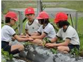
吉之元小学校 吉之元小学校 吉之元小学校 吉之元小学校 吉之元小学校 吉之元小学校 吉之元小学校 吉之元小学校 吉之元小学校 吉之元小学校