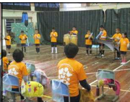
アフリカンシンフォニー