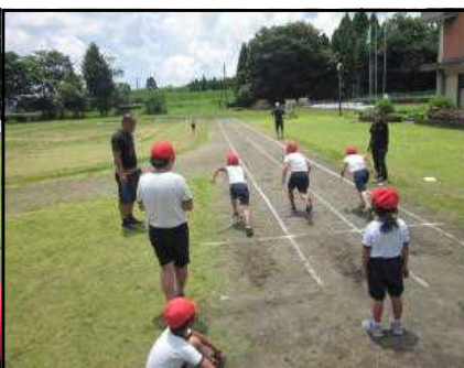
前傾姿勢でスタート