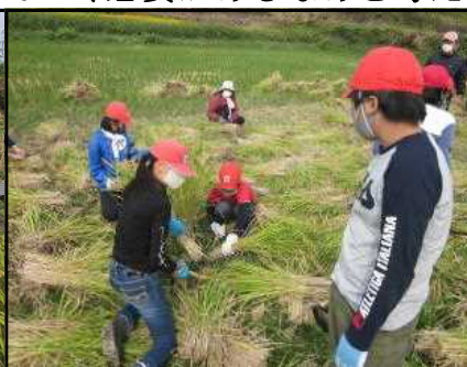
けっこう むっかしなあ