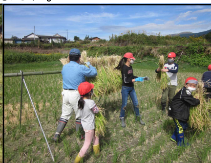
干し方が でひなこっじゃ