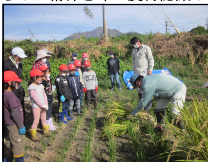
こげんして すったっどお

実りの秋にふさわしく、見事に実ったもち米を収穫しました。稲刈りとかけ干しです。例年のことで、1年生以外は慣れた手つきでの作業ぶりでした。しかし、もち米は穂が落ちやすく、刈った後の地面には黄金に輝く少なからぬ量の小さな宝物（もっごめ）が落ちていました。「もったいないなあ」とか「鳥の餌になるのかなあ」と言いながら、小さな袋に落ち穂拾いをする児童の姿から、ふと、子どもの頃の親の教えを思い出しました。「ご飯は、残さず食べなさい。一粒でも残したら目がつぶれるぞ」と厳しく言われたものです。「もったいない」は都城弁で「あったらし」です。時代は違いますが、あったらしか精神を今一度再認識していく必要があるなあと考えました。