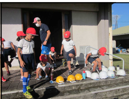
ヘルメットでびんたを守る