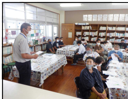
学校運営協議会(西岳3校)

どひこばっかい答えがなったでしょうか？ これを質問した本意は、吉之元小学校のことをこれまで以上に知って欲しいということです。知ることは愛情の第一歩です。学校への愛情がふるさと吉之元を愛することにつながります。コロナが心配な状況ではありますが、だからこそ、地域の方の学校支援が絶対に必要です。そこで、吉之元人に切なるお願いです。 まちった 小学校に 来てみっください。