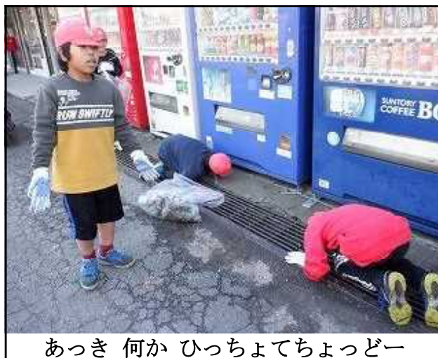
あつき 何か ひっちゃてちょっどー

これからも微力であっても何かを実行することで、ふるさと吉之元への愛情を深めてもらいたいと思います。