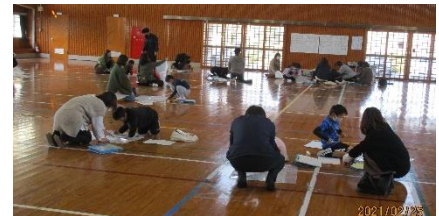
【1年生 親子で凧づくり】

各学年、生活科、国語科、外国語等の授業参観はどうでしたか。どの学級も全児童の成長した姿を見ることができたのではないのでしょうか。学級経営にご協力とご理解をいただいたことに感謝申し上げます。