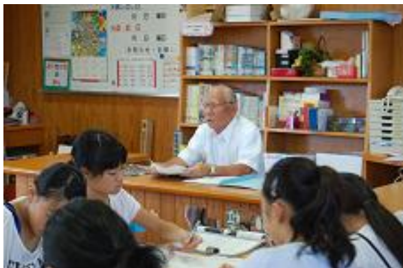
【安藤様による講話】