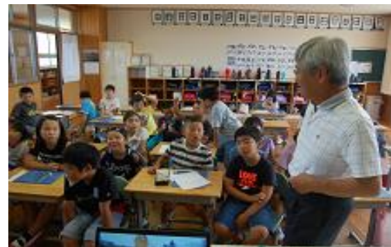
【永田様による講話】