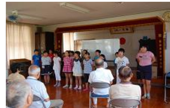
【弘川公民館での学習】

公民館に行って、地域の方々と健康体操をしたり、校歌を披露したりしました。とても喜んでいただきました。