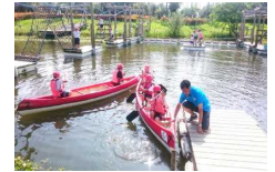
【フィールドアスレチック】