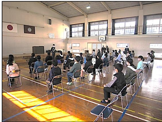
【卒業式の練習に真剣に取り組む6年生】

さて、卒業式まであとわずかとなりました。6年生は、卒業式を「最後の授業」という思いで、歩き方や礼の仕方、姿勢など、担任の先生方の指導を受けながらがんばっています。卒業式当日は、立派な姿を見せてくれることと思います。