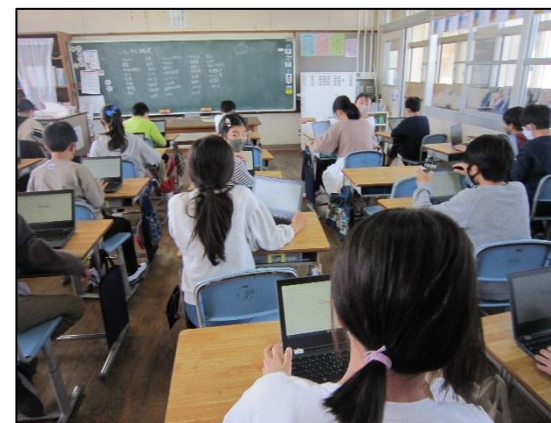
上学年に一人一台のパソコンが届き、さっそく授業で活用しています。下学年にも、もうすぐ届く予定です(^_^)