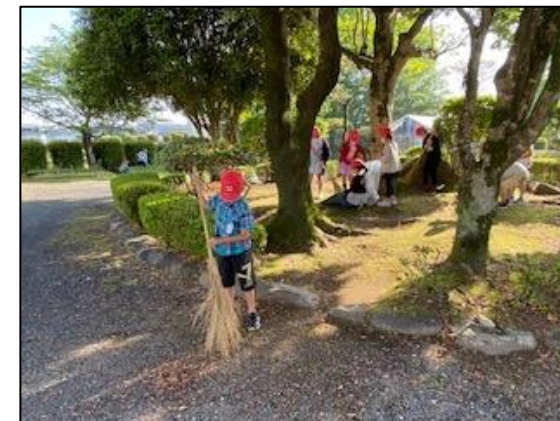
登校後すぐ、朝のボランティア活動に取り組む子ども達。一生懸命に掃除をする姿に感謝の思いでいっぱいになります。