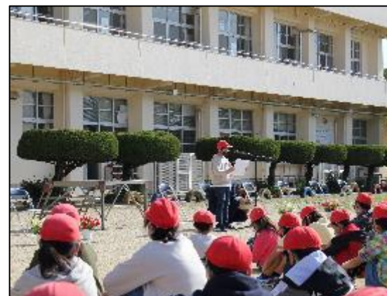
晴天に恵まれて、始業式を運動場で行うことができました。6年生が代表で新学期の抱負を発表してくれました。