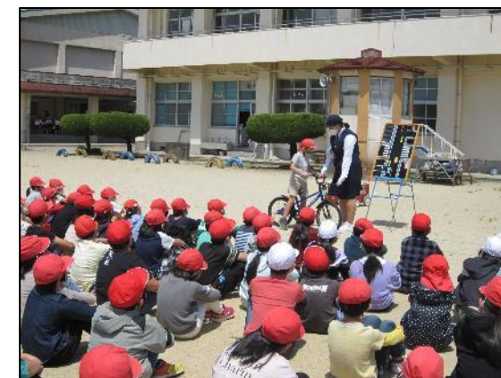
22日(木)、都城市交通安全協会の方を講師にお招きして、全学年で交通安全教室を実施しました。