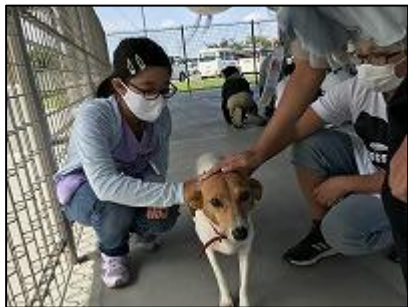
「いのちの教育」(5年生)

台風の接近で開催が心配された運動会も盛会のうちに終わり、各クラスではそれぞれに充実した学習活動が行われています。2学期は、1年間の中で学習面、生活面でもっとも充実する学期です。様々な学びを通して、子ども達は着実に成長しています。