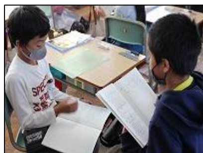
「かけ算の学習」(2年生)

【児童の下校時刻】 4校時の日 14:00頃 5校時の日 15:10頃 6校時の日 16:00頃 ～ 保護者のみなさま、地域のみなさまによる登下校時の見守り活動をいつもありがとうございます。～